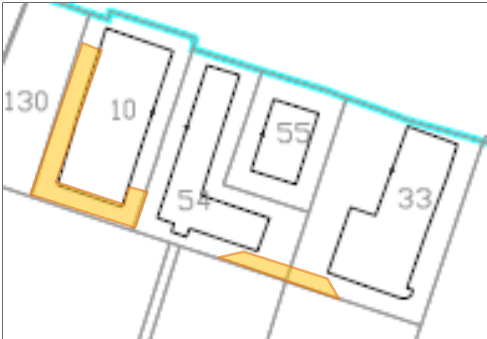
Figura 2: modello con evidenziate le aree contaminate con terre di fonderia