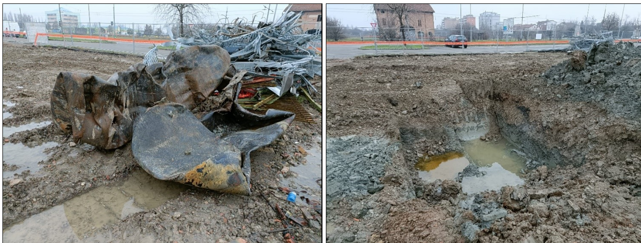
Figura 6: cisterne da gasolio rimosse e dettaglio del terreno nel suo intorno