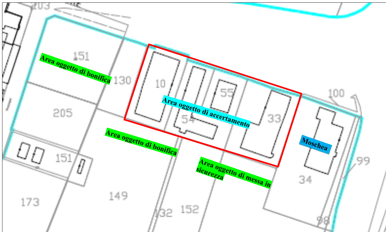
Figura 1: Dettaglio area di interesse

Si riporta un report al 08/02/2023 dello stato qualitativo dei terreni da scavo rinvenuti nell'area Ex-Neon Modena ed Ex-Tetracciai, ovvero una stima dei quantitativi di scavo per restituire l'area idonea dal punto di vista ambientale e tecnico rispetto alle opere di futura realizzazione ( Figura 1 ).