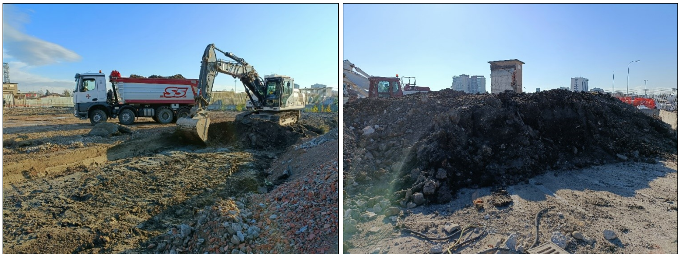
Figura 3: fasi di scavo e cumulo di terre di fonderia da smaltire

2) I terreni di riporto misto in cui sono presenti scarti di natura edilizia mescolati con frazioni argillose plastiche, di cui al punto 2), hanno una distribuzione disomogenea, ma sono presenti su quasi tutta l'area. Dal punto di vista prestazionale la forte eterogeneità del terreno spinge i progettisti verso la sostituzione di una parte del riporto con terreno riciclato granulare uniforme, opportunamente steso e rullato. Lo spessore medio del terreno di riporto NON CONFORME da rimuovere è stato stimato in circa 60/70 cm, per una cubatura stimata in peso pari a circa 2000 ton. Dal punto di vista ambientale tali terreni presentano caratteristiche tali da NON rendere possibile un loro reimpiego come sottoprodotto, ovvero è necessario il conferimento in discarica come rifiuto non pericoloso con codice EER 17 05 04.