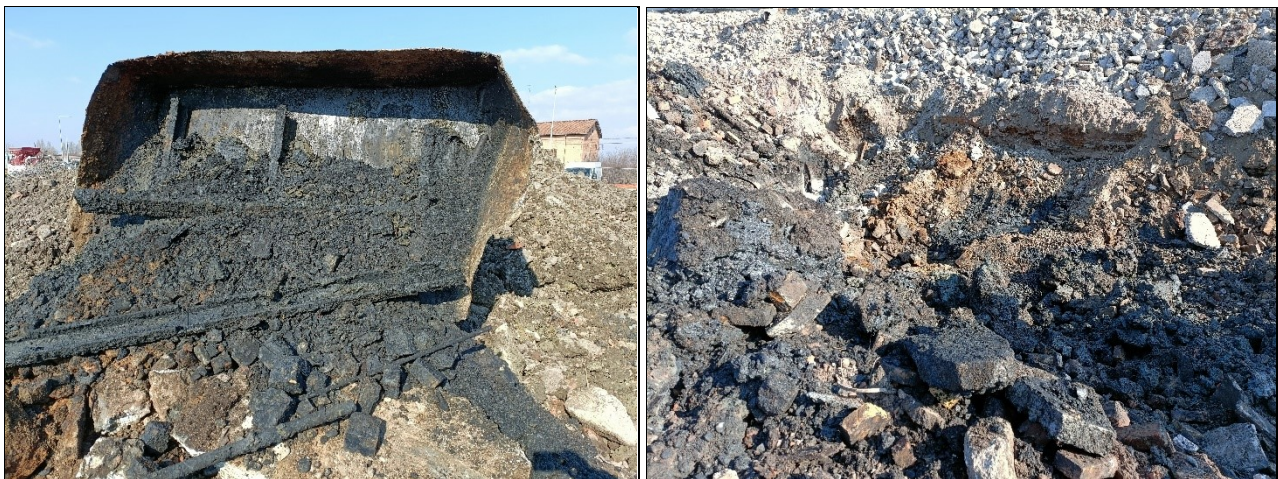
Figura 5: cisterna in acciaio rinvenuta sotto una soletta in calcestruzzo e dettaglio del terreno nel suo intorno

I terreni potenzialmente inquinati al di sotto della Ex-Tetracciai si approfondiscono per circa 1,3/1,5 m dal piano campagna, mentre per l'esatta estensione areale bisognerà attendere che vengano ultimate le demolizioni e spostati i cumuli di macerie che ricoprono il sito potenzialmente contaminato.